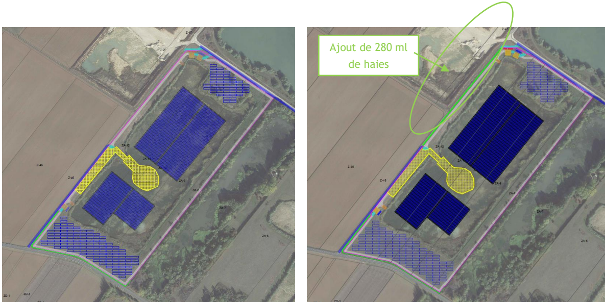
Modification non substantielle du plan de masse de Lac de Cloyes 3